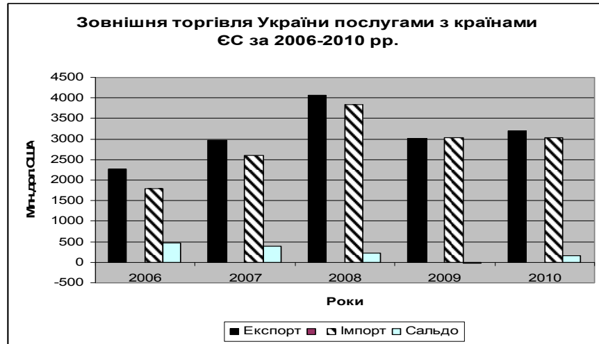
Рис. 2. Динаміка зовнішньої торгівлі України послугами з країнами ЄС 2006-2010 рр.

експорту до країн ЄС займали транспортні (64,3%), різні ділові, професійні та технічні (16,4%) послуги, імпорту – фінансові (21,1%), транспортні (16,8%), будівельні (7,2%), роялті та ліцензійні (8,1%) послуги.