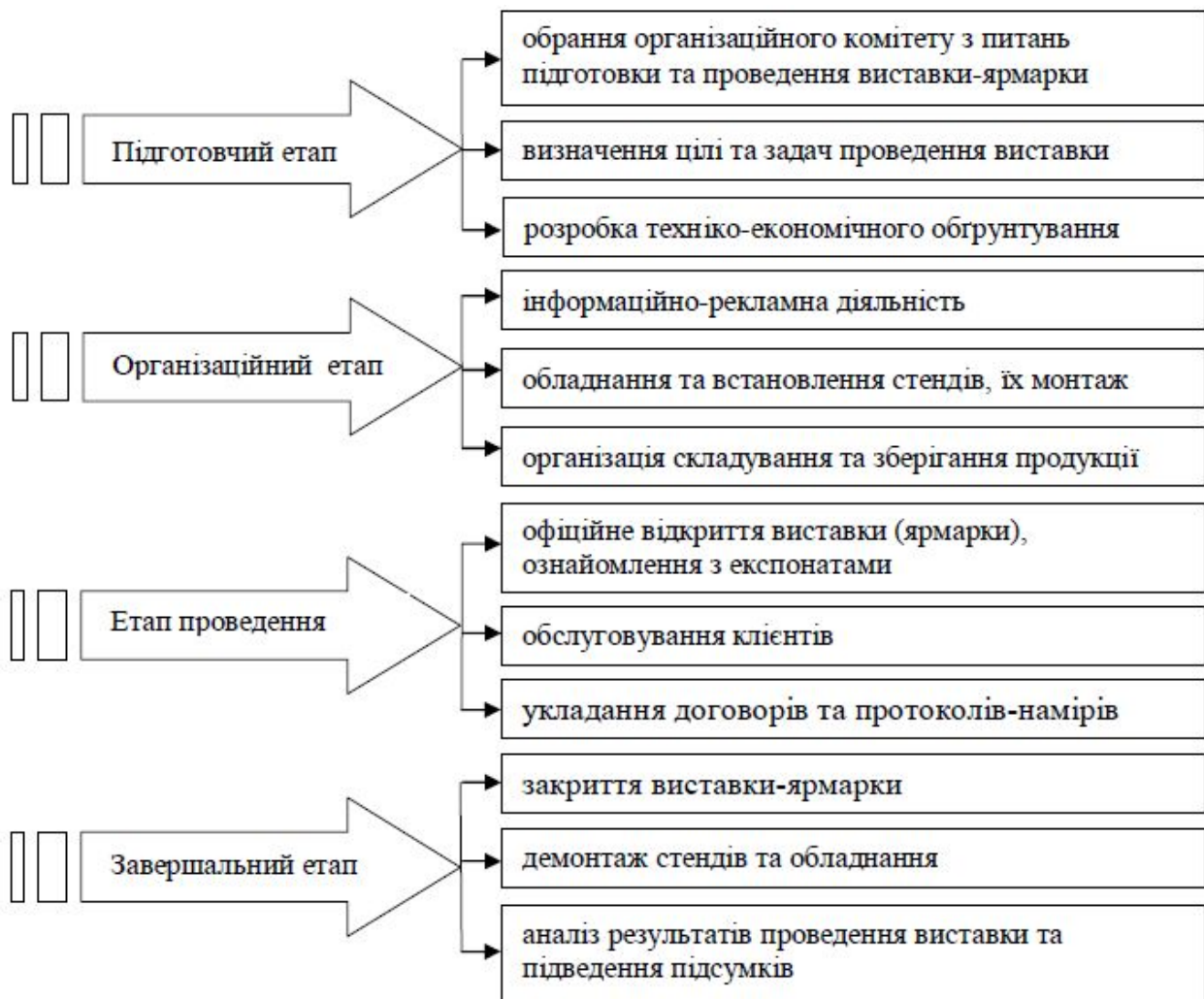
Рис. 2. Схема поетапного проведення виставок та ярмарок