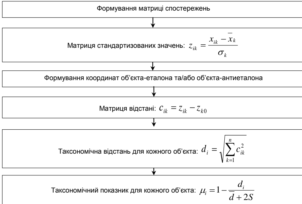
Рис. 2. Етапи таксономічного аналізу конкурентного потенціалу підприємства

Поетапно застосування методу таксономічного аналізу відображено на рис. 2.