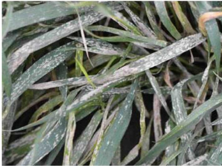
Рис. 3. Прояв збудника бурї іржі Blumeria graminis f.sp. tritici на посівах тритикале озимого, ІСГП НААН України (с. Грозине), 2009 р.

Отже, під час вегетації рослин гриб може розповсюджуватись конідіями і сумкоспорами. Зараження рослин проходить за температури 0-20 °С і відносній вологості повітря 50-100 %. Висока температура повітря (понад 30 °С) затримує розвиток борошнистої роси. Інкубаційний період - 3-11 діб (в середньому 4-5) [2, 3]. Збудник борошнистої роси у фітоценозах зернових озимих культур з'являється і розвивається восени. Зрозуміло, що резервантами його є сходи падалиці, тонконогові бур'яни тощо. Зимує патоген на посівах озимини і сходях падалиці у формі скупчень грибниці [2, 3]. Отже, безсумнівно, науково обґрунтоване чергування сільськогосподарських культур є основою зменшення інтенсивності прояву збудників хвороб. Але роль генотипу сорту чи лінії також є передумовою високого і якісного урожаю і для успішного керування біосистемою «господар-патоген», необхідно в агроекосистемах підтримувати різноманітність за ознакою стійкості як у часі, так і у просторі з урахуванням внутрішньо популяційних структур патогена [8]. Селекція і вивчення нових генотипів сільськогосподарських культур (пшениці, тритикале, жита) в певних агроекосистемах різних екоотопів, дозволили виявити низку перспективних форм, які серед властивих їм переваг, здатні найповніше