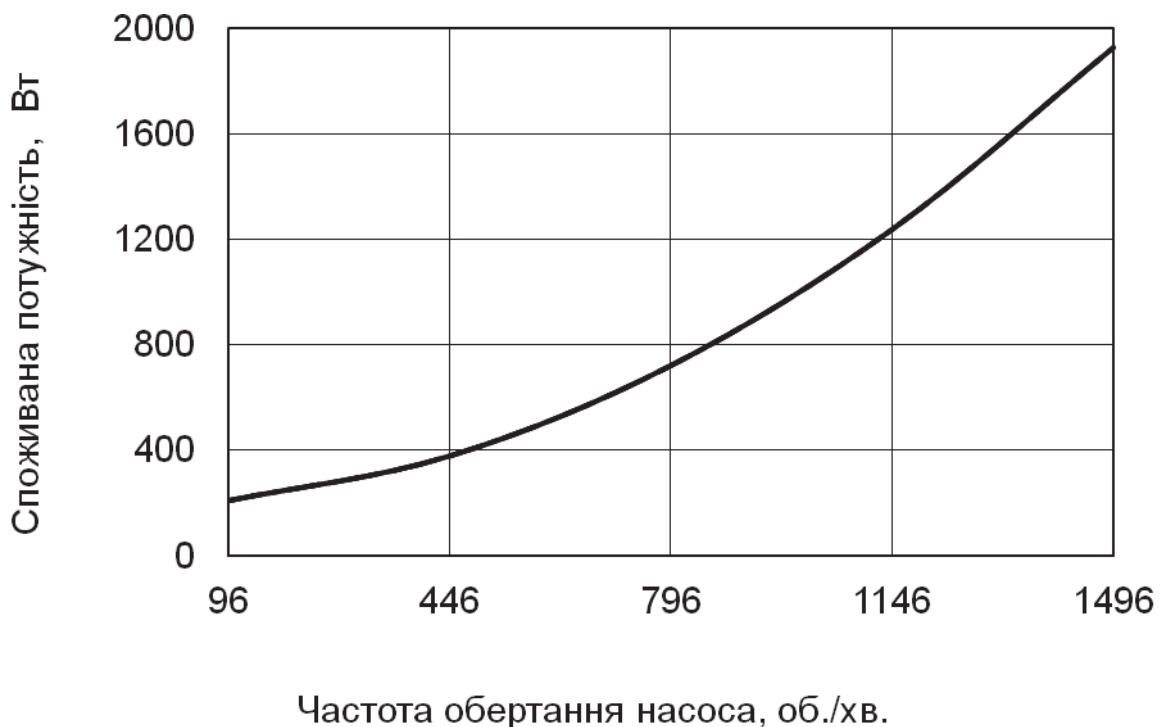
Рис. 1. Залежність споживаної потужності дискового змішувача від частоти обертання насоса