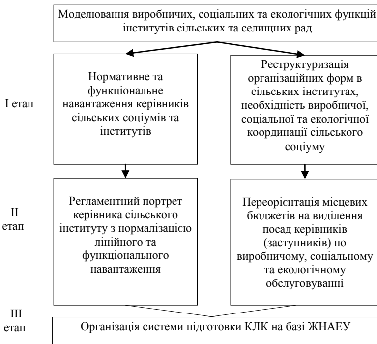
Рис. 3. Проект підготовки кадрів-лідерів кооперації та екології.

На Житомирщині виношується проект формування школи таких лідерів на базі ЖНАЕУ.