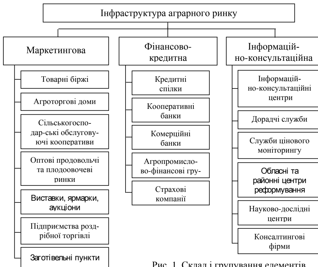
Рис. 1. Склад і групування елементів інфраструктури аграрного ринку

Встановлено, що під інфраструктурою аграрного ринку слід розуміти систему підприємств та установ, які забезпечують взаємозв'язки між структурними елементами окремих сільськогосподарських товарних ринків і сприяють вільному руху товару, підтримуючи безперервний процес функціонування сфери аграрного виробництва і безперебійне постачання ресурсів сільськогосподарським товаровиробникам та готової продукції кінцевим споживачам . Формування інфраструктури аграрного ринку повинне здійснюватися за умови синхронного розвитку трьох його складових: маркетингової, фінансово-кредитної й інформаційно-консультаційної (рис. 1). Залишаючись самостійними і маючи власну функціональну спрямованість, складові інфраструктури аграрного ринку постійно взаємодіють та взаємно доповнюють одна одну.