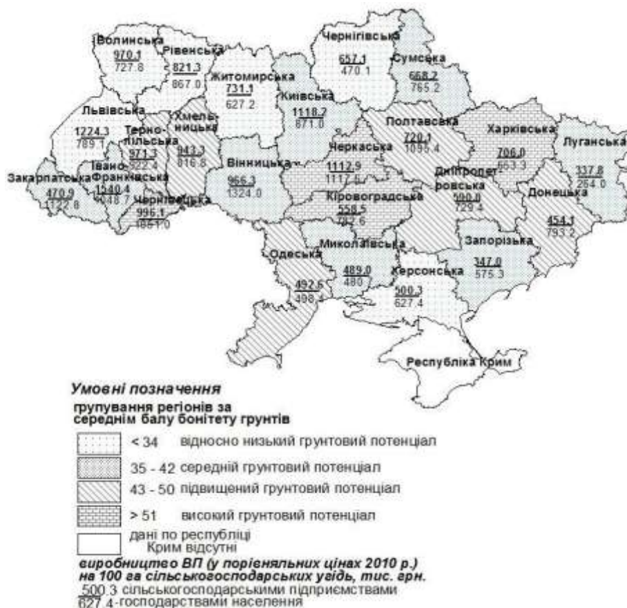
Рис. 2. Ефективність використання земельного фонду, 2014 р.

Про ефективність використання земельного фонду землевласниками та землекористувачами свідчать обсяги вартості виробництва валової продукції у розрахунок на 100 га сільськогосподарських угідь (рис. 2).