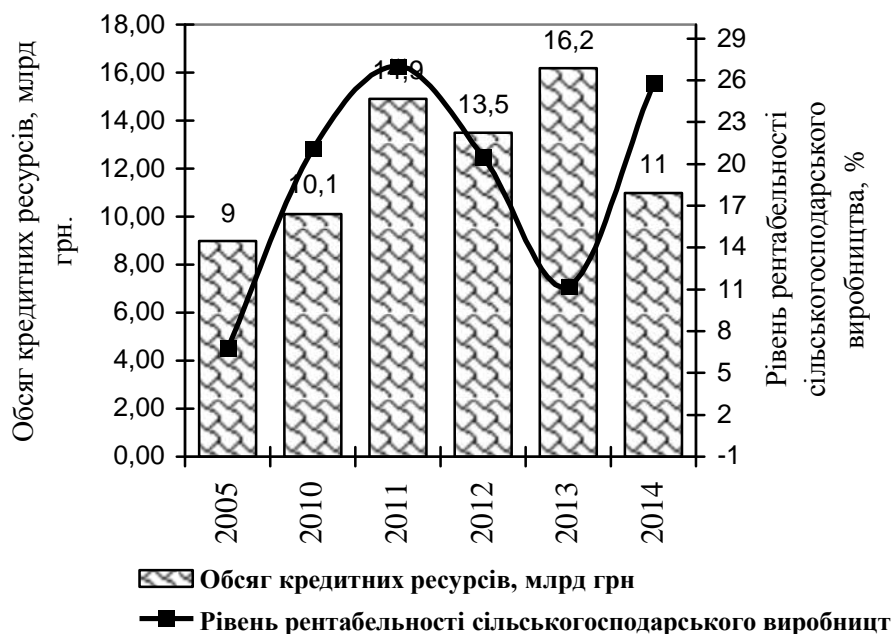
Рис. 3. Вплив обсягу залучених кредитних ресурсів на рівень рентабельності виробництва в сільськогосподарських підприємствах

Проведений аналіз впливу обсягу залучених кредитних ресурсів на рівень рентабельності виробництва у сільськогосподарських підприємствах за 2005–2014 рр. засвідчує, що для здійснення виробничих програм в аграрному секторі залучили кредитів на суму 11 млрд грн, що на 2 млрд грн більше, ніж у 2005 р. (рис. 3).