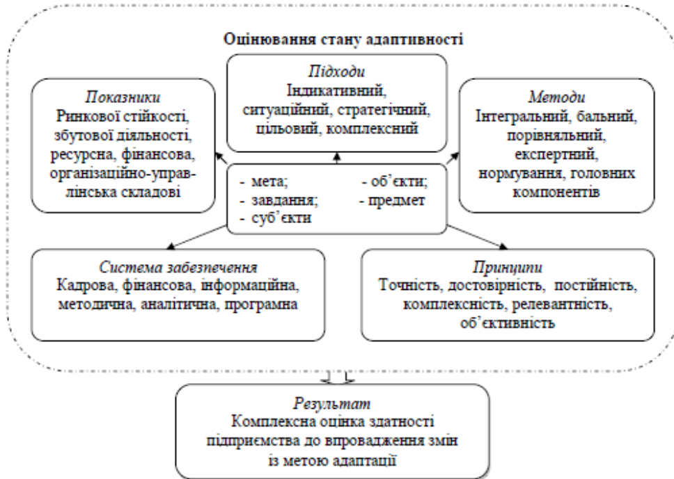
Рис. 1. Концептуальна схема оцінювання стану адаптивності підприємства