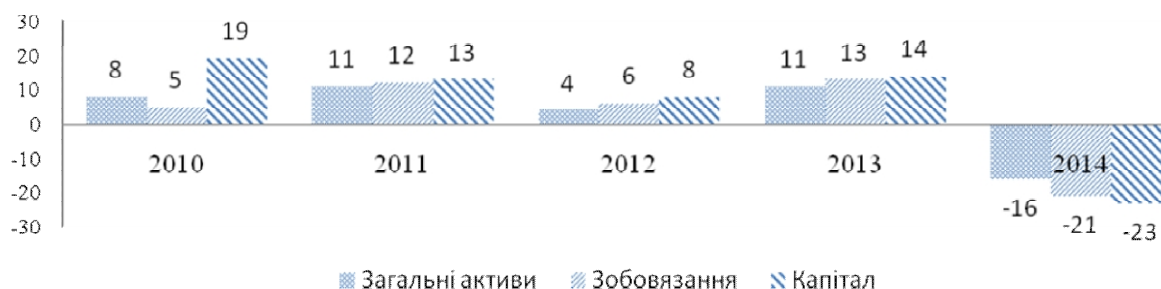
Рис. 2. Темпи приросту загальних активів, зобов'язань та капіталу банківського сектору України, %

активів, зобов'язань та капіталу банків у 2014 р. вперше за п'ять останніх років набули від'ємних значень (рис. 2).