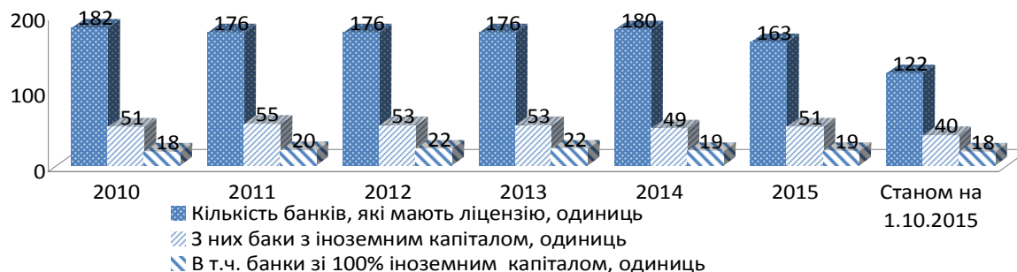
Рис. 1. Кількість банків, які мають банківську ліцензію, станом на 1 січня відповідного періоду, одиниць

жовтні цього ж року у Державному реєстрі банків було зафіксовано рекордно низьку за останні роки кількість банківських установ – 122 одиниці. Помітним був і відтік банків з іноземним капіталом, лише впродовж 10 місяців 2015 року їх кількість зменшилася до 40 одиниць (рис. 1).