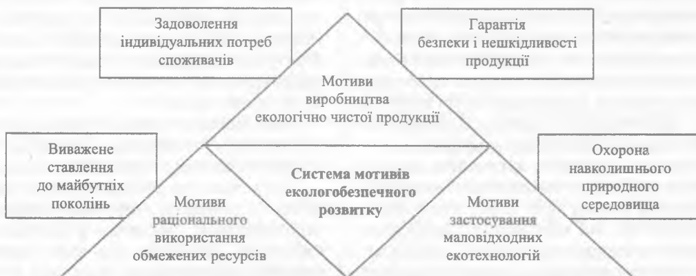
Рис. 3. Система мотиваційного менеджменту екологічного розвитку сільськогосподарського підприємства

Мотивація — це внутрішнє чи зовнішнє спонукання економічного суб'єкта до діяльності з метою досягнення певних цілей: інтерес до певної діяльності та способи його ініціювання, спонукання. Мотивація діяльності взагалі є системою мотивів, що розглядаються в єдності соціального, економічного та психологічного начал, цілей і завдань механізмів реалізації [133; с. 492]. Серед інших визначень на увагу заслуговує те, що мотивація — це сукупність спонукальних факторів, які визначають активність особистості: мотиви, потреби, стимули, ситуативні чинники, які спонукають поведінку людини [74, с. 7]. Враховуючи зазначене, можна сформувати систему мотивів екологічного розвитку сільськогосподарського підприємства (рис. 3).