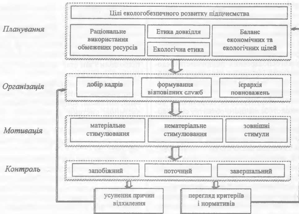
Рис. 2. Мотивація екологічного розвитку в системі менеджменту сільськогосподарського підприємства