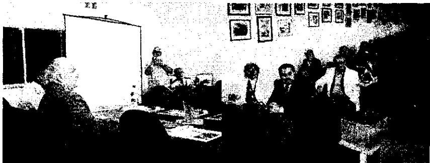
На науково-практичній конференції «Наука. Молодь. Екологія — 2008»

Щороку на конференції запрошуюються члени НМК аграрної освіти, прибувають делегації з інших ВНЗ України та зарубіжних країн.