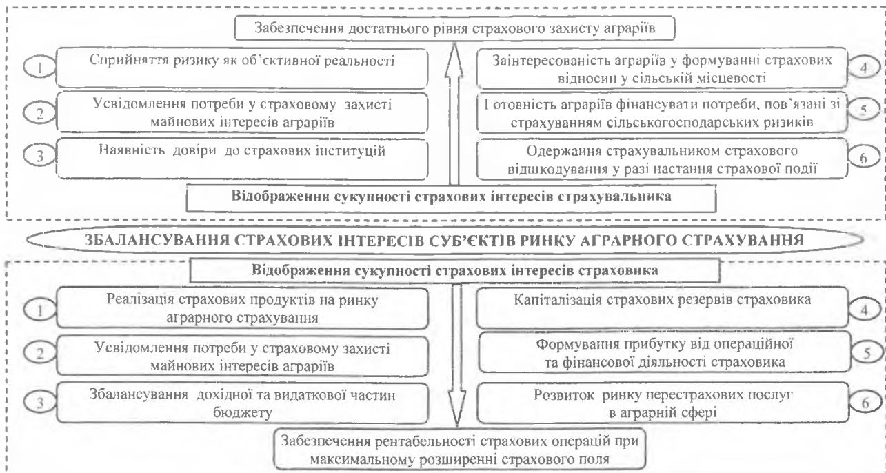
Рис. 2. Сукупність страхових інтересів учасників ринку аграрного страхування

та здійснення витрат за результатами операційної й фінансової діяльності, використання сучасних маркетингових технологій на страховому ринку та оптимізація бізнес-процесів страховика) і стратегічних (розширення страхового поля страховика й підвищення його конкурентоспроможності на ринку, а також адаптації його діяльності до вимог загальноєвропейського страхового простору) завдань розвитку страхового бізнесу. Зіставлення страхових інтересів страхувальників та страховиків створює необхідну основу для розвитку попиту і пропозиції на страховому ринку (рис. 2).