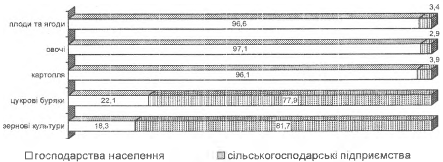
Рис. 2. Питома вага господарств у виробництві основних сільськогосподарських культур у 2007р., %

7,2%. До 2007р. особливу роль у стриманні спаду виробництва тваринницької продукції відігравали господарства населення, але у 2007р. виробництво валової продукції тваринництва знизилось на 12%, а в сільськогосподарських підприємствах – на 10,8%.