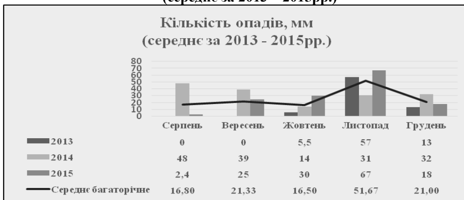
Рис. 2. Кількість опадів, мм (середнє за 2013 – 2015 рр.)