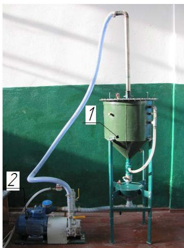
Рис. 1. Установка УВДБ-100Ф для дослідної перевірки енергетичної ефективності виробництва дизельного біопалива в циркуляційних змішувачах: 1 – циркулярний змішувач, 2 – гідростанція

Для проведення випробувань використовувалися ріпакова олія, яка кількістю 160 л закачувалася за допомогою гідростанції до циркуляційного-змішувача для етерифікації.