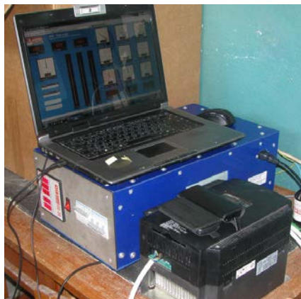
Рис. 2. Блок виміральної та фіксуєчої апаратури

Гідростанція складалася із шестеренчастого насоса НШ 100, спеціально розробленої запобіжної муфти, асинхронного електродвигуна потужністю 5 кВт та номінальною частотою обертання 1500 об/хв і системи трубопроводів, оснащених спеціальними лічильниками.