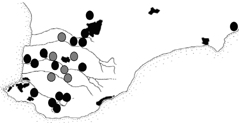
Рис. 2. Належність популяцій до двох головних клад (чорні та сірі кола), що було виділено для сумісного фенетико-географічного аналізу за трьома поліморфними конхіологічними системами молюска H. lucorum

Отримані оцінки ефективної чисельності популяцій достатньо низькі та відповідають отриманим раніше показникам для іншого виду цього роду Helix aspersa , що також існує у вигляді дрібних, дискретних, напівізольованих колоній – 15–215 особин [5]. Раніше було встановлено, що для H. lucorum зазначаються дуже низькі оцінки щільності популяцій – 0,5–1,0 особина на 1 м 2 (В.М. Попов, особисте повідомлення).