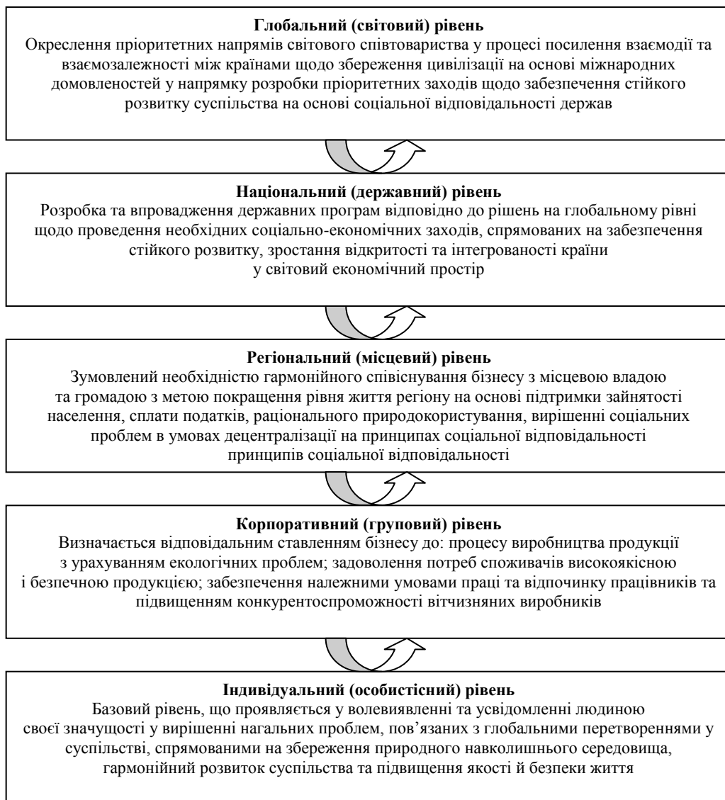
Рис. 1. Ієрархія рівнів соціальної відповідальності щодо забезпечення сталого розвитку суспільства