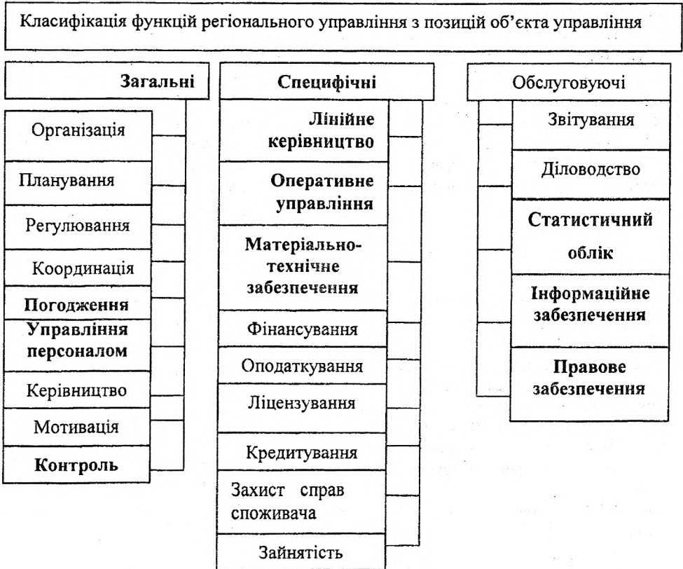
Рис. 2 Класифікація функцій регіонального управління з позиції суб'єкта управління .

Однак найбільш поширеною є класифікація з точки зору суб'єкта управління (рис. 2)