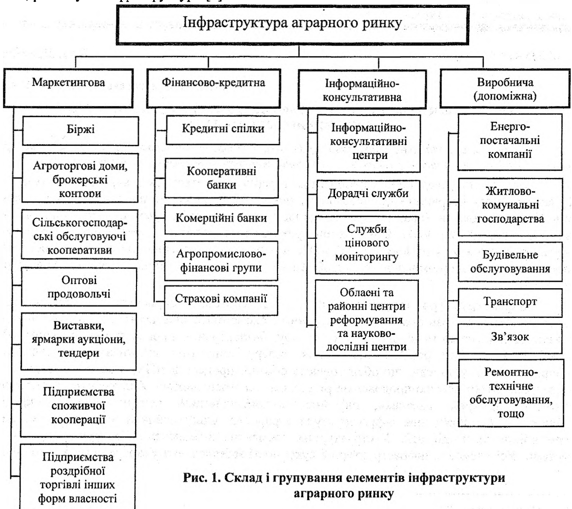
Рис. 1. Склад і групування елементів інфраструктури аграрного ринку

Одним із основних елементів інфраструктури аграрного ринку є товарні агропромислові біржі . Головним змістом діяльності товарної біржі є створення найсприятливіших умов для укладання товарних угод, а головною функцією – організація постійно діючого оптового товарного ринку і надання посередницьких послуг учасникам біржових торгів. Нормальне функціонування товарної біржі можливе в умовах ринкового середовища, самостійності підприємств різних форм власності й господарювання, насичення ринку біржовими товарами, великої кількості продавців, покупців та посередників, стабільності грошової системи, розвинутої інфраструктури [1].