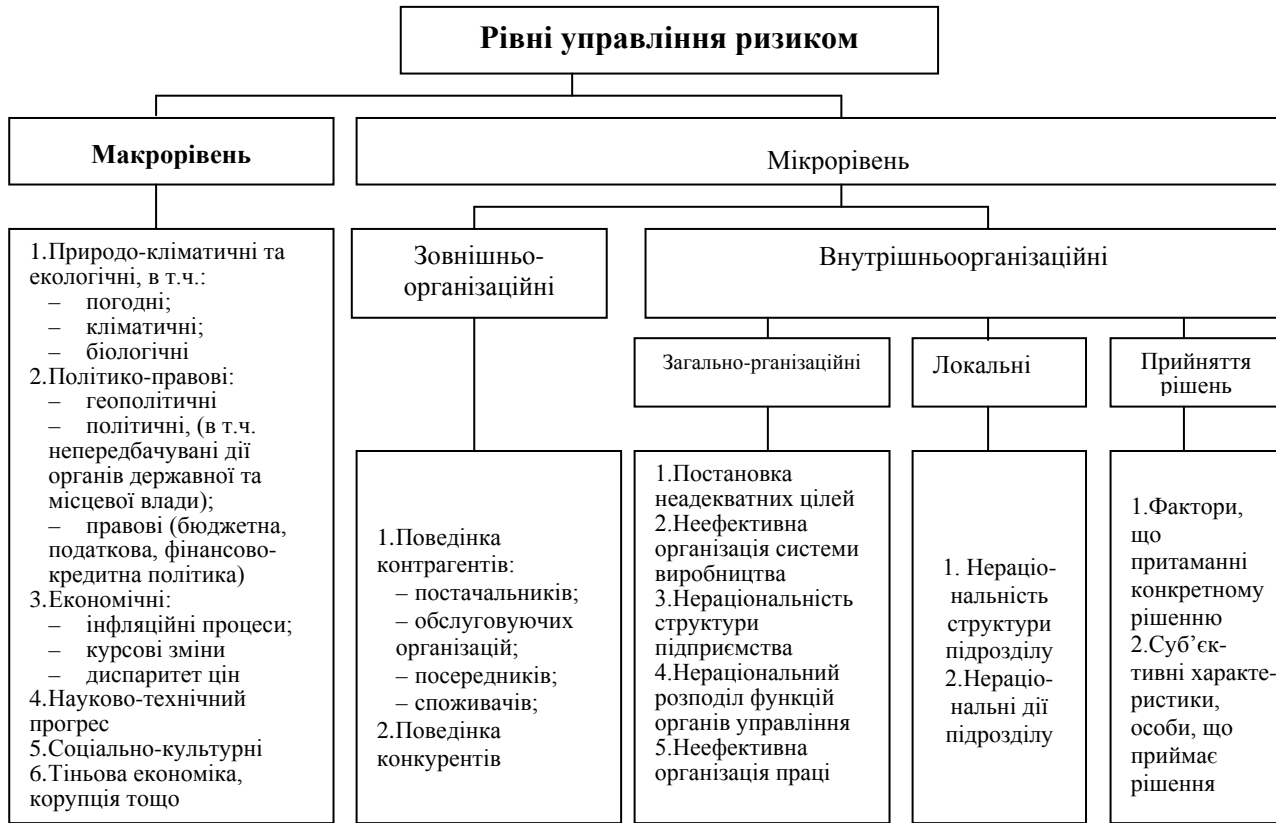
Рис. 1. Фактори підприємницького ризику виробництва хмелесировини