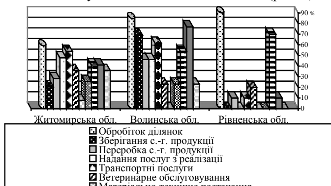
Рис 2. Напрями діяльності кооперативів при сільських громадах Північно-Західного економічного регіону

Встановлено, що кооперативи при сільських громадах є, в основному, багатофункціональними, оскільки охоплюють кілька видів діяльності і надають різні види послуг своїм клієнтам-власникам (рис. 2).