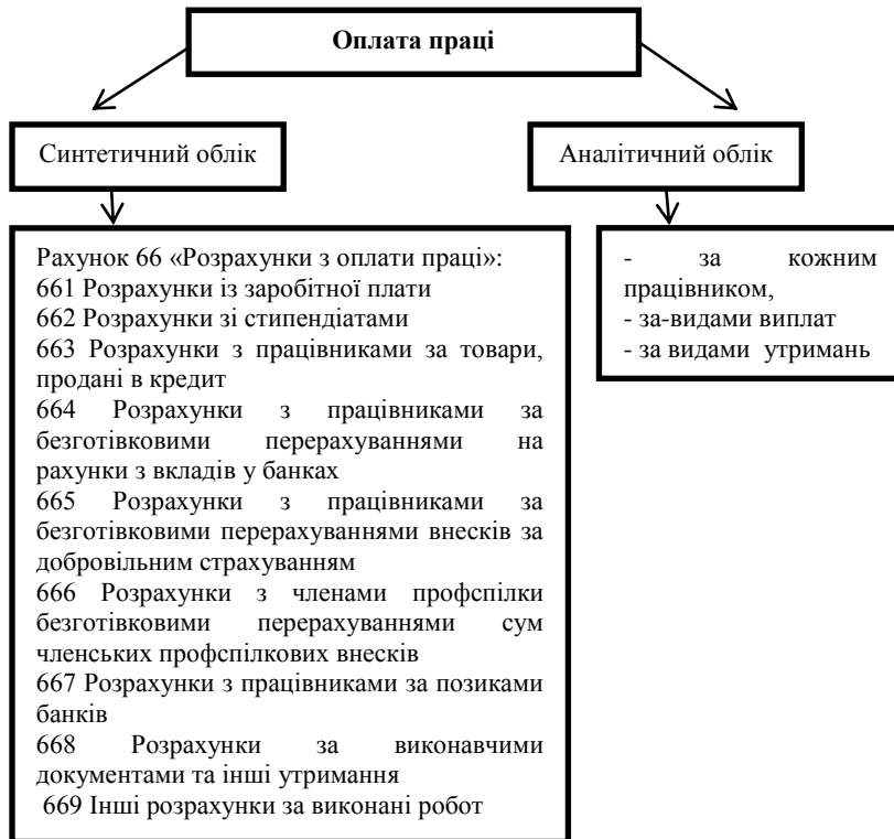
Рис. 2 Порядок організації аналітичного та синтетичного обліку оплати праці в бюджетних установах

розрахунки з персоналом, який належить як до облікового, так і до необлікового складу підприємства, з оплати праці (за всіма видами заробітної плати, премій, допомоги тощо). Порядок організації аналітичного та синтетичного обліку представлено на рис. 2: