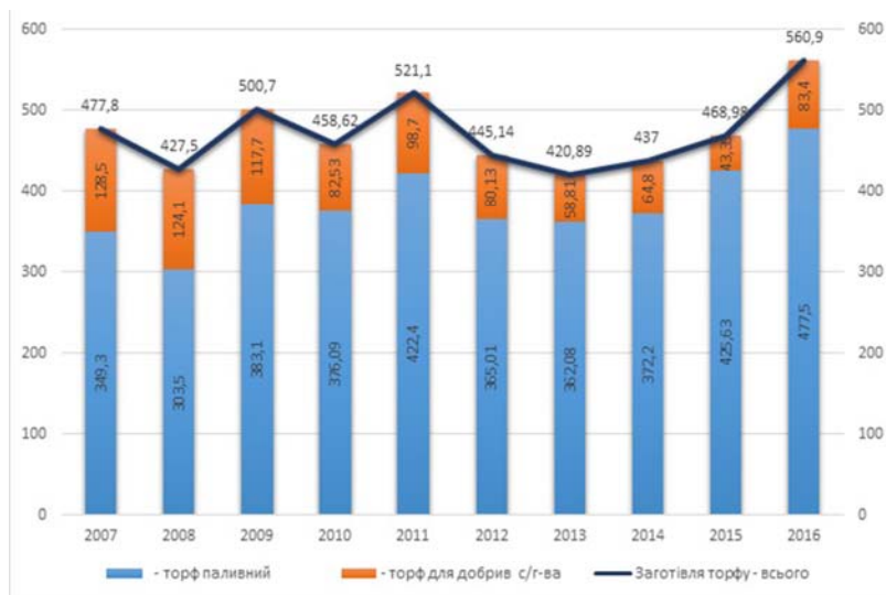
Рис. 1. Видобуток торфу підприємствами Державного концерну «Укрторф» 2007–2016 рр., тис. т.

близько 936,1 млн т [3]. За останні десять років рівень видобутку торфу коливався у межах 420, – 521,1 тис. тонн, мало коливаючись до 2013 року (рис. 1). І лише за останні роки намітилася тенденція росту видобування торфу, що обумовлено збільшенням споживання паливного торфу. При цьому, використання торфу в сільському господарстві в якості добрив постійно знижувалося, склавши у 2015 році лише 43,3 тис. тонн. Торф використовується наразі переважно для виробництва субстратів, стимуляторів росту рослин і практично не використовується для удобрення відкритого ґрунту. Це великий резерв, на який варто звернути увагу.