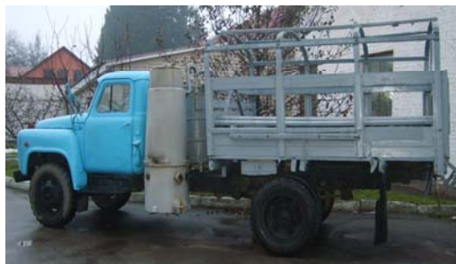
Рис. 6. Автомобіль ГАЗ-53А з газогенераторною установкою

За результатами проведених досліджень в ЖНАЕУ була розроблена та досліджена газогенераторна установка, оптимізація експлуатаційних параметрів та дизайну якої дозволила перевести автомобіль ГАЗ-53А на рослинне паливо (рис. 6). З урахуванням потреб потенційних споживачів та особливостей експлуатації обладнання, було розроблено газогенераторний енергетичний модуль (рис.7). У дизайні враховувалися вимоги, сформульовані в таблиці 1.