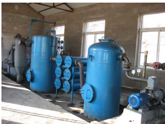
Рис. 4. Газогенераторна установка потужністю 200 кВт, що працює на рослинних залишках сільськогосподарського виробництва вологістю до 30 % (розробка Ліонінського інституту енергетичних ресурсів, КНР)