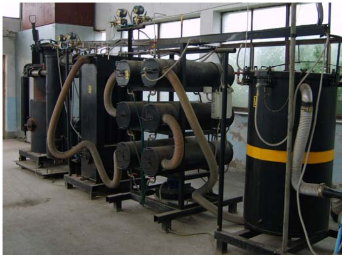
Рис. 2. Газогенераторна установка ENEA (виробництво Італії) силовою потужністю 80 кВт, яка працює на деревних відходах вологістю 25...30 %

Цікаво підкреслити той факт, що в США, де досить скептично відносяться до перспектив переходу навіть сільськогосподарської техніки на генераторний газ,