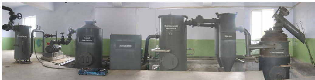
Рис. 3. Газогенераторна установка тепловою потужністю 300 кВт, що працює на рослинних залишках аграрного виробництва вологістю до 40 % (розробка Ліонінського інституту енергетичних ресурсів, КНР)

Енергетика більшості країн, що розвиваються, характеризується широким використанням ДВЗ у якості генераторів для забезпечення потреб в електроенергії, особливо в сільській місцевості. Це обумовлено відсутністю розгалуженої системи енергетики. Технологія газифікації твердих палив для двигунів внутрішнього згорання, після мінімальної підготовки, має специфічну важливість. Так, установка на рис. 2 використовується для виробництва електроенергії, а установка на рис. 3 виробляє генераторний газ для мережі теплопостачання.