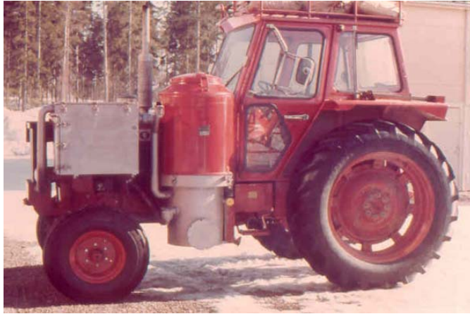
Рис. 1. Газогенераторний трактор фірми Volvo, який працює на pelletованих рослинних відходах

ілюстрації наведені приклади енергетичних установок та комплексів, створених у різних країнах (рис. 1–5). Подібність дизайну таких виробів може навести на думку, що в конструктивному аспекті вони досягли оптимальності співвідношення ціни, форми та експлуатаційних характеристик.