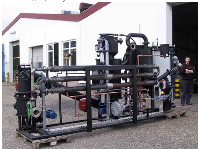
Рис. 5. Газогенераторна установка фірми Spanner RE GmbH (виробництво Німеччини) силовою потужністю 100 кВт, яка працює на деревних відходах вологістю до 30 %

Німецька установка (рис. 5) виробництва фірми Spanner RE GmbH має підвищену надійність за рахунок автоматизації робочих процесів і достатньо високий ККД (в межах 89...92 %).