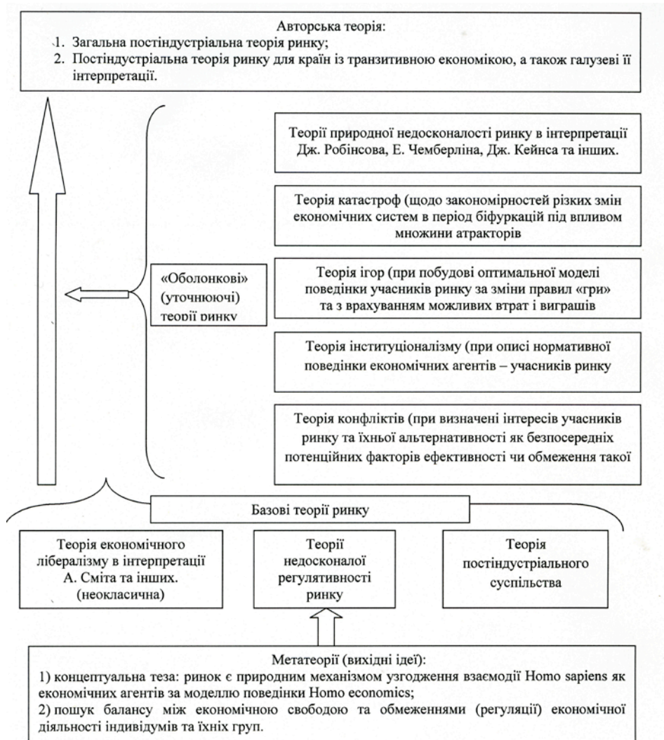
Рис. 2. Методологія авторських досліджень на теоретичному рівні

При описі методологічного алгоритму наших досліджень було враховано: наявність і допустиму об'єктивну одночасність абсолютного і умовного значення (істин) ринку; можливість, поступовість і змістовну ретроспективність процесу пізнання моделей ринку як шляху від визначення абсолютних значень та їх доповнення у змінних умовах до формування певного кумульованого уточненого на цій основі варіанту; об'єктивність і необхідність узгодження ролі базового і універсального теоретичного підґрунтя сутності ринку.