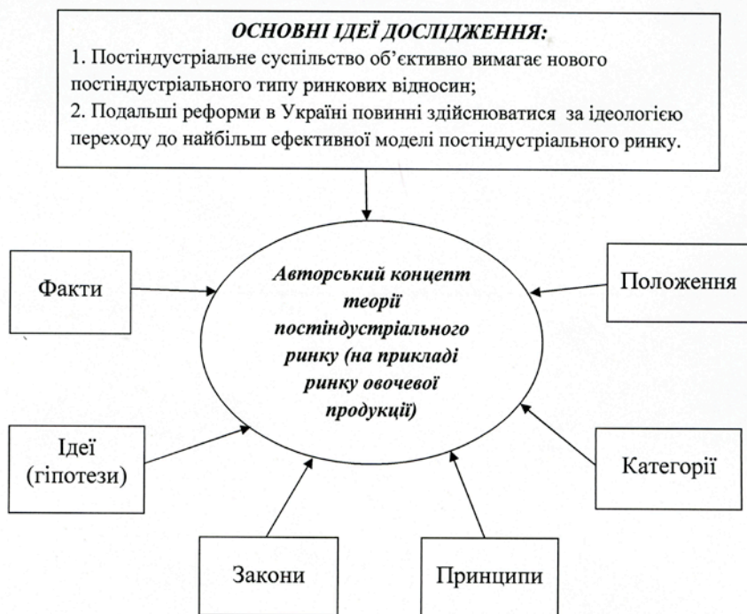
Рис. 4. Методологія досліджень авторської теорії на рівні опису

Зазначена методологія була відповідно є реалізованою в авторських дослідженнях при обґрунтуванні місця і ролі теорії «універсальної моделі ринку». На рис. 4 представлено зміст концепту теорії «універсальна модель ринку» в умовах постіндустріального суспільства, а саме: 1) факти (ефекти), які стали основою для постановки питання про необхідність перегляду традиційних поглядів на закономірності і природу теорії ринку (на прикладі ринку овочевої продукції України); 2) ідеї та гіпотези, що слугували вихідним імпульсом досліджень; 3) закони, що розглядалися автором як вихідний базис аналізу; 4) постулати і принципи, що були виділені автором при окресленні оригінального змісту запропонованої теорії; 5) нові категорії, які було сформульовано і розглядалися як ключові; 6) перелік і зміст положень, які винесені як основні в межах представленої теорії і які, як вважається, відбивають її сукупність доказово обґрунтованих висловлювань.