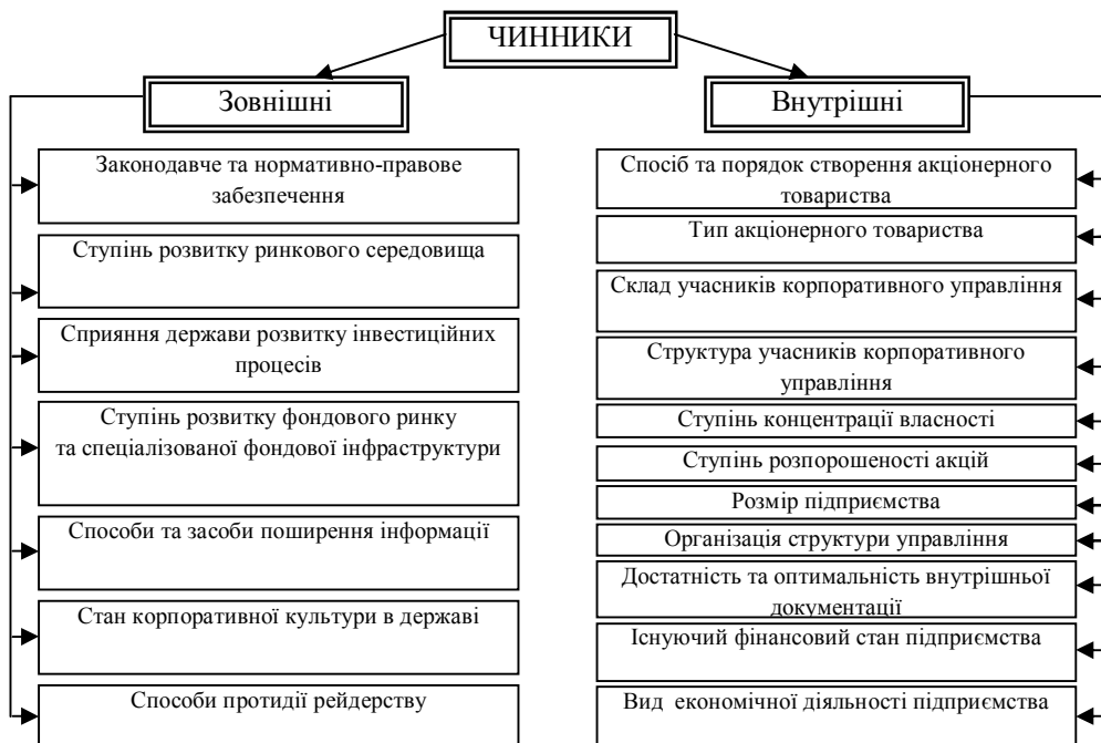
Рис. 3. Чинники, що впливають на формування механізму корпоративного управління в акціонерному товаристві

Отже, під механізмом корпоративного управління розуміємо комплексну організовану структуру відносин між суб'єктами та об'єктами управління, що діє через використання всієї сукупності законів, способів, методів, норм й інструментів щодо узгодження інтересів корпоративних учасників в рамках мети функціонування акціонерного товариства. Формування механізму корпоративного управління повинне ґрунтуватися на використанні принципу цілісності, що припускає взаємозв'язок елементів, які впливають на створення синергетичного ефекту.