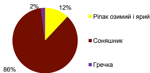
Рис. 1. Структура посівів основних ентомофільних культур в Україні

У середньому за останні п'ять років соняшник становить 86% площ посівів ентомофільних культур в Україні (рис. 1). Під ріпаком озимим і ярим зайнята площа у 7 разів менша, під гречкою – у 36.