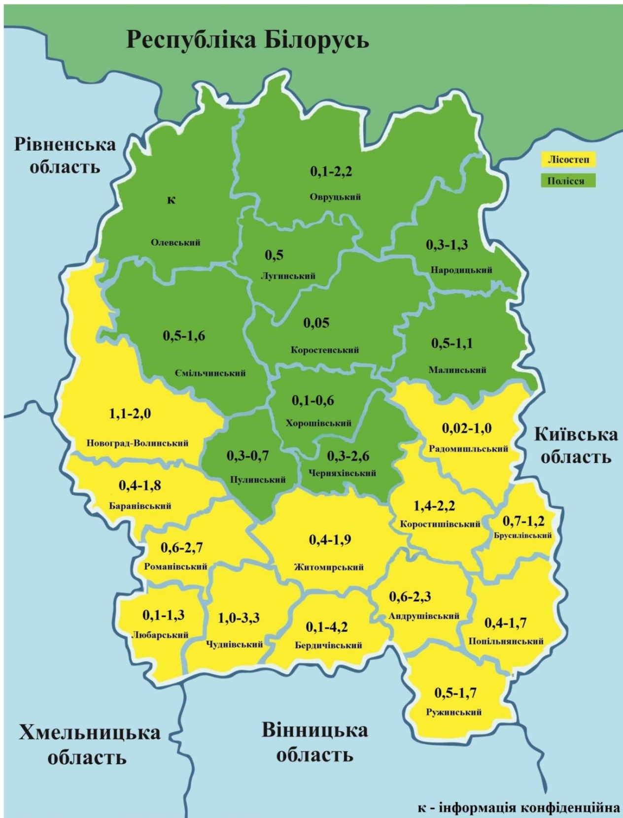
Рис. 3. Карта посівів ріпаку озимого на Житомирщині, тис. га

Попільнянському, Житомирському, Ружинському, Брусилівському та Баранівському) та у двох – поліських (Черняхівському і Ємільчинському). У цих районах його частка від загальної кількості в області коливається від 5 до 11%. Даний показник у решти районів становить 0,2–4%.