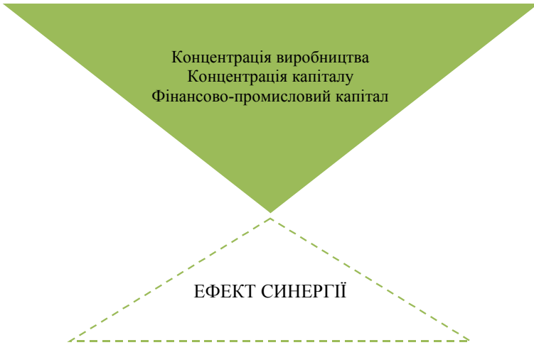
Рис. 3. Структурний зміст інтегрованої корпоративної структури

Отримання синергетичного ефекту, одержуваного в результаті консолідації крупних капіталів у структурі інтегрованої корпоративної структури залежить як від складу системоутворюючих елементів, так і від способу їх об'єднання, гармонії зв'язків між ними, іншими словами від організаційної цілісності. Чим більш різноманітними і комплексними є взаємозв'язки, тим більшою є кількість способів взаємодії між привернутими в систему елементами, тим вище організаційний потенціал системи як цілісного утворення. Це означає, що наявність або відсутність синергетичного ефекту об'єднання капіталів залежить від вибору форми інтегрованої корпоративної структури.