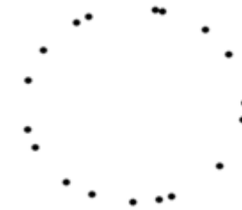
Рис. 1. Сприйняття кола (формування образу кола)

гештальт, як його людина сприймає, як він діє і які наслідки цієї дії на людину (рис. 1).