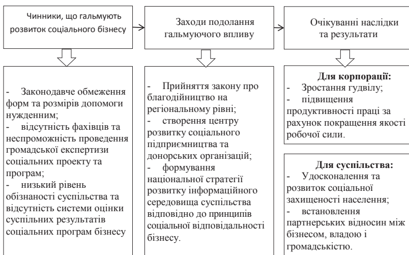
Рис. 2. Управління практикою поширення соціально-відповідального бізнесу

поративних програм з охорони та зміцнення здоров'я співробітників; реалізація корпоративних програм морального стимулювання персоналу; реалізація благодійних і спонсорських проектів; участь у формуванні позитивної суспільної думки про бізнес. Аналіз практики успішних українських компаній дозволяє виділити такі напрямки розвитку соціально відповідального бізнесу: забезпечення належних умов для здобуття базової освіти; покращення рівня медичного обслуговування населення; розбудова інфраструктури села; збереження навколишнього середовища; впровадження енергозберігаючих новітніх технологій на виробництві [4–5]. Узагальнююче схематичне відображення чинників гальмування розвитку соціально відповідального бізнесу, інструментів подолання гальмуючого впливу та очікуваних результатів наведено на рис. 2. Екологічність становить основу сучасного іміджу і комерційного успіху компаній. Своєю участю у покращенні екології країни підприємці можуть зробити набагато більше для здорового майбутнього країни та її жителів. Водночас, позиціонування компанії як орієнтованої не безпечно господарювання та ощадливе ресурсовикористання виступає важливою складовою підвищення її гудвілу.