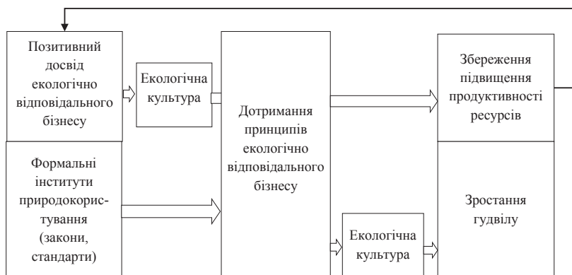
Рис. 3. Інструменти управління та результати реалізації екологічно відповідального бізнесу корпорацій