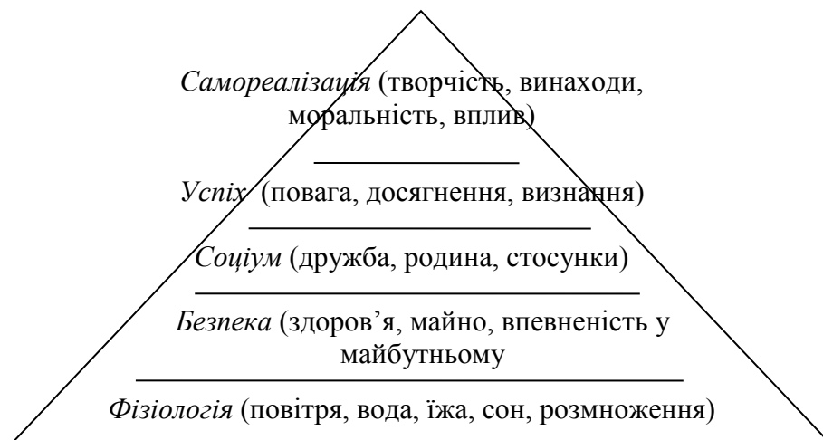
Рис. 4. Піраміда А. Маслоу в системі багатофункціонального розвитку

Не зменшуючи значущість здобутків постіндустріального суспільства, яке сприяє задоволенню потреб особистостей відповідно до піраміди А. Маслоу, головним чином, за рахунок розроблення та впровадження технологій, визначальною рушійною силою, головними ресурсом модернізації країни є люди. При цьому не варто забувати, що антропоцентрична позиція у світогляді вичерпала себе через наслідки від її поширення. Протиставлення людиною себе природі, завоювання і насильне підкорення позбавило, таким чином, людство коріння та цілісності. Проблема виникла внаслідок посилення думки, що людина більш організована,