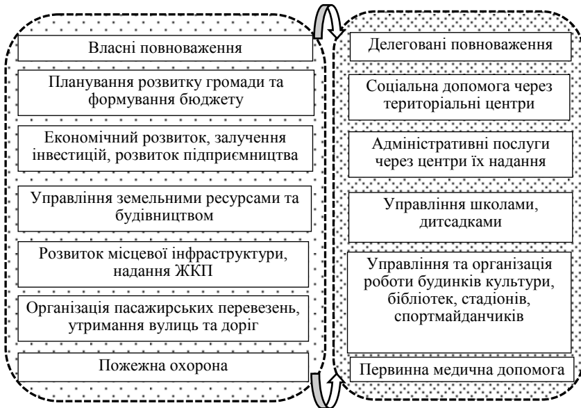
Рис. 1. Повноваження органів місцевого самоврядування

ресурси та інфраструктурний потенціал для належного виконання повноважень (рис. 1).