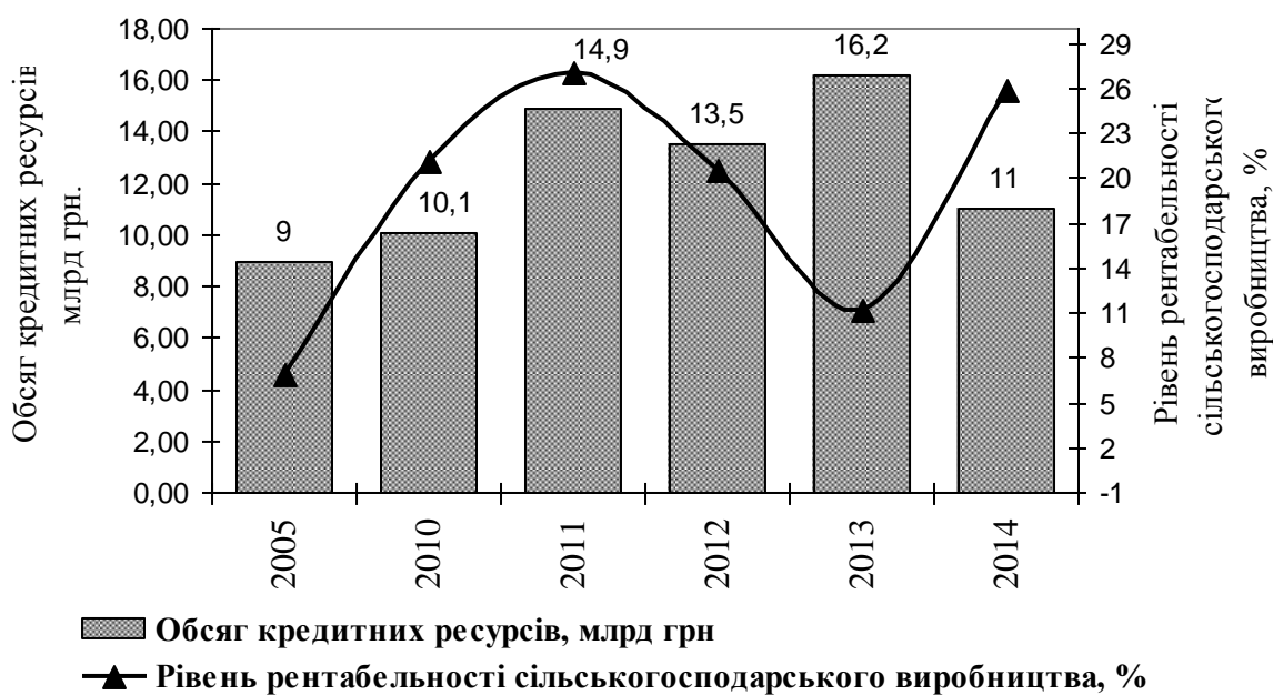
Рис. 2. Вплив обсягу залучених кредитних ресурсів на рівень рентабельності виробництва в сільськогосподарських підприємствах

Так, з 2005 р. по 2011 р. відбувалось постійне зростання обсягів кредитних ресурсів в аграрне виробництво з 9 до 14,9 млрд грн та, відповідно, рівня його рентабельності з 6,8 до 27%. Проте у 2013 р. відбулося падіння рівня рентабельності виробництва сільськогосподарської продукції на 9,3 % після зменшення кількості залучених кредитних ресурсів у 2012 р. у порівнянні з 2011 р. майже на 1,4 млрд грн. У 2013 р. в аграрний сектор залучено майже 16,2 млрд грн позикового капіталу, і, відповідно, за досліджуваний період становить найвищий показник. Адже негативним є те, що у 2014 р. залучений позиковий капітал у сільське господарство зменшився у порівнянні з 2013 р. майже на 5,2 млрд грн, що пояснюється низьким рівнем ефективності сільськогосподарського виробництва, і, як наслідок, зменшенням ліквідності та платоспроможності сільгосп підприємств, а також відсутності необхідних гарантій швидкого повернення залучених кредитних ресурсів.