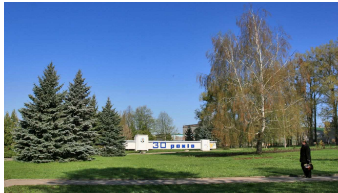
Рис. 2. Декоративна група з участю ялини колючої ( Picea pungens "Glauca") на майдані Польовому у Житомирі