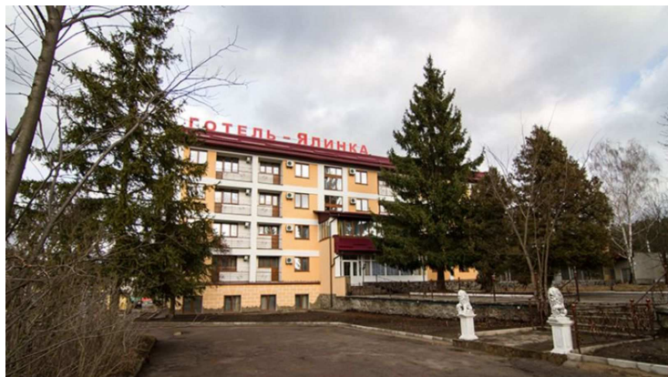
Рис. 3 Декоративні групи з участю ялини звичайної ( Picea abies ) на проспекті Миру у Житомирі

Результати дослідження. У зелених насадженнях Житомира серед хвойних порід переважно представлені ялина звичайна ( Picea abies ) – 30 % та ялина колюча ( Picea pungens ) форма "Glauca" – 70 %, обстежено 163 дерева віком від 40 до 80 років, що ростуть на ділянках з високим техногенним навантаженням (табл. 1), уздовж центральних автошляхів міста та у промисловій зоні.