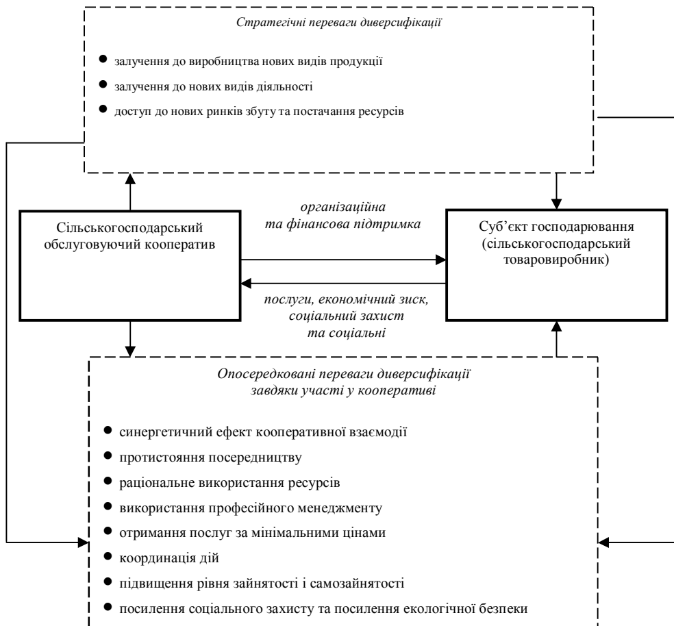
Рис. 1. Вплив сільськогосподарської обслуговуючої кооперації на розвиток диверсифікації діяльності малих та середніх аграрних підприємств