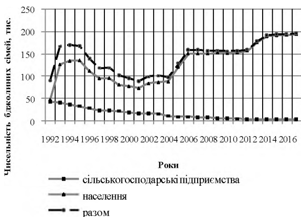
Рис. 1. Динаміка чисельності бджолиних сімей на Житомирщині

Встановлено, що за двадцять п'ять років – з 1992 до 2017 р. – кількість бджолосімей на Житомирщині зросла у 2 рази (рис. 1).