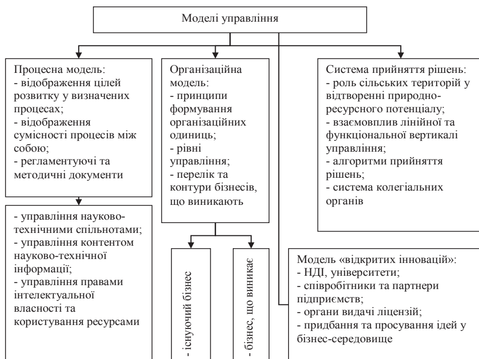
Рис. 2. Базові моделі управління підприємництвом на сільських територіях