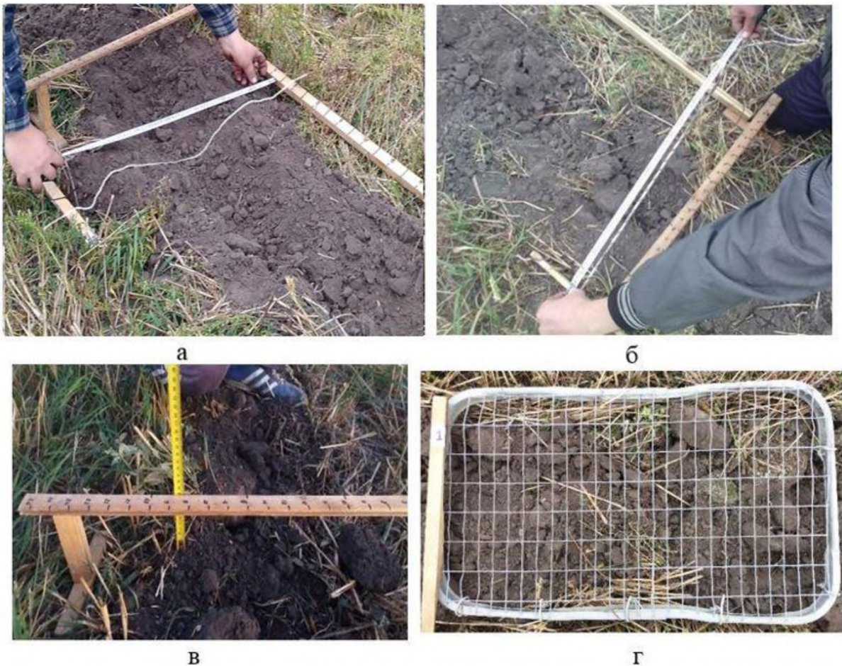
Рис. 2. Визначення якості обробленої смужки

а, б – визначення поперечної нерівності поверхні методом видовження шнура; в – визначення поперечної нерівності поверхні за допомогою профілювання; г – вимірювання грудкуватості поверхні з накладанням облікової рамки.