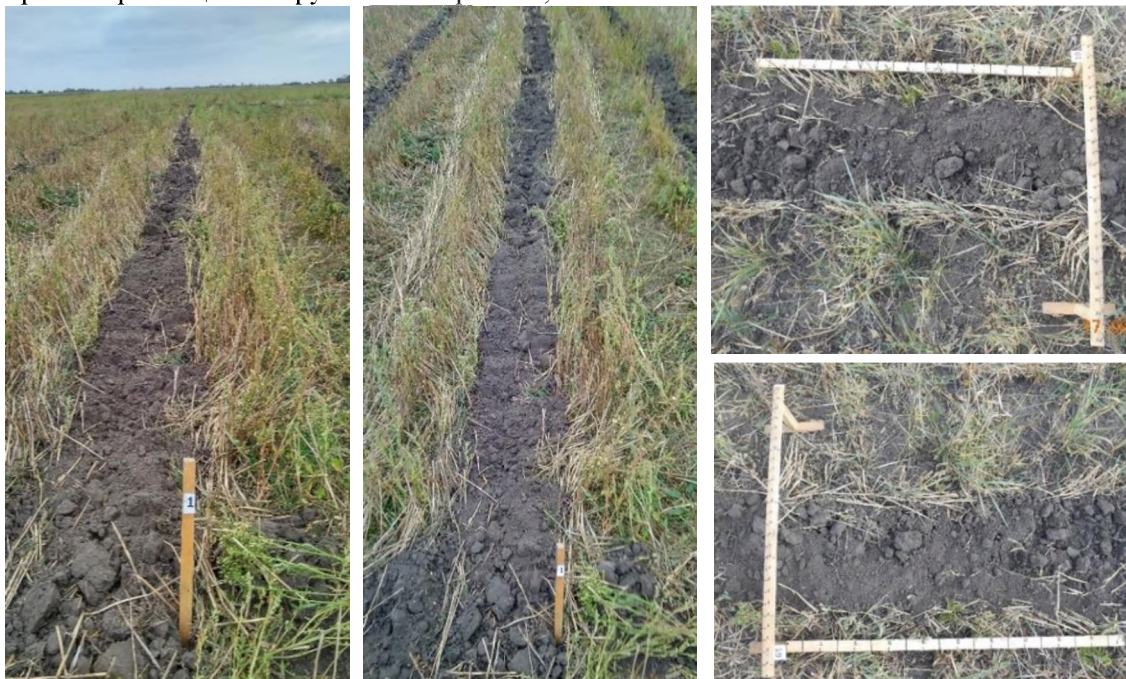
Рис. 1. Загальний вигляд та фотографування обробленої смужки

загальний стан стерні та рослинні рештки. Фотографування обробленої смужки дозволяє комплексно охарактеризувати її зовнішній вигляд та провести подальше оцінювання за межами поля.