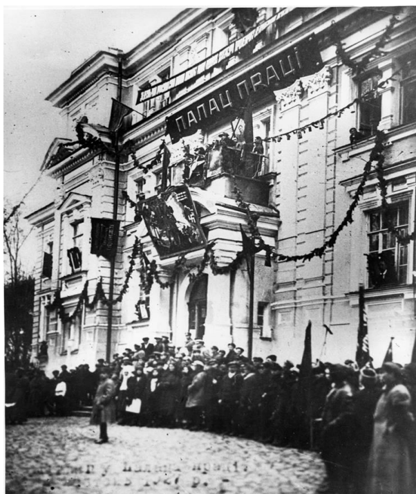
У будинку колишнього Волинського окружного суду, де нині розташовано перший корпус університету, до 1930 року був Палац праці.