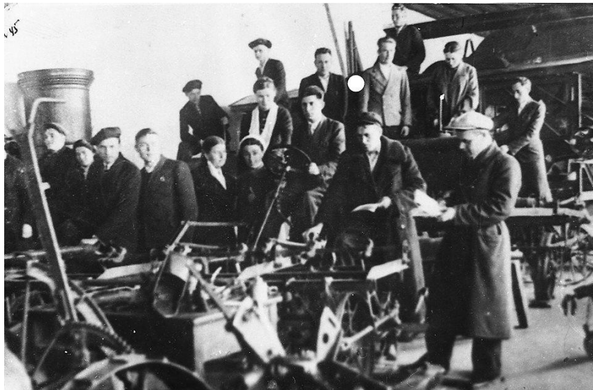
Заняття в лабораторії механізації сільського господарства, 1935 р.