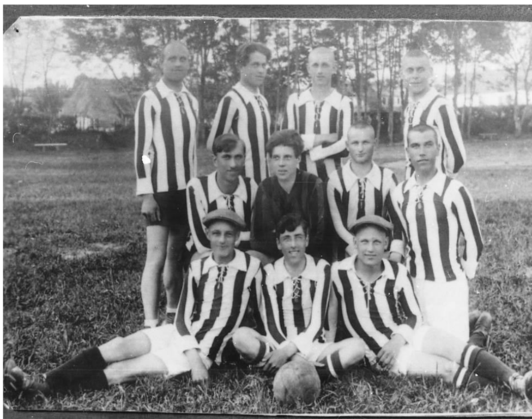
Футбольна команда Волинського агротехнікуму, 1929 р.