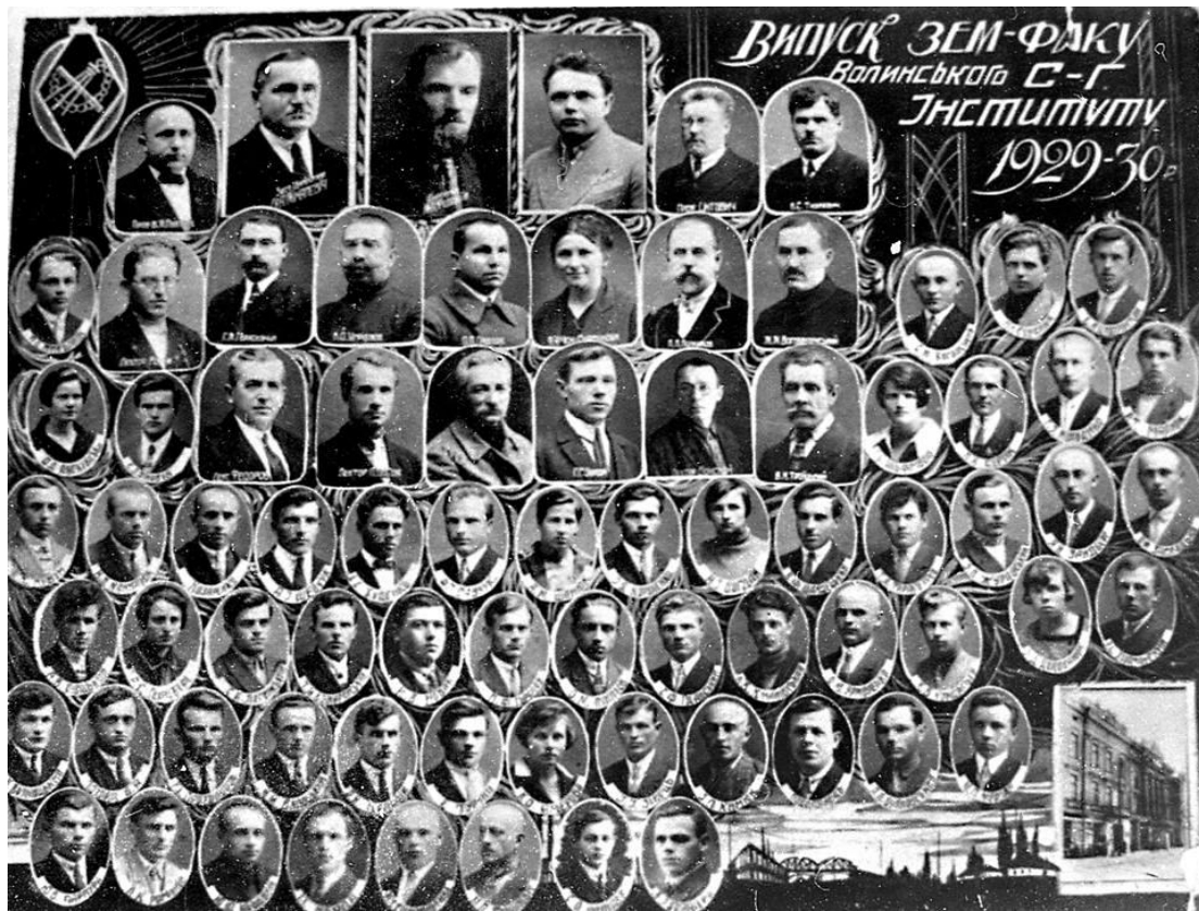
Випуск землевпорядного факультету 1930 р.