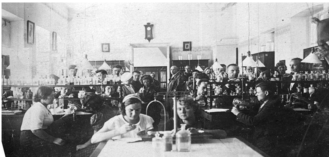
Заняття на хмільовому відділі ЖСГІ, 1934 р.