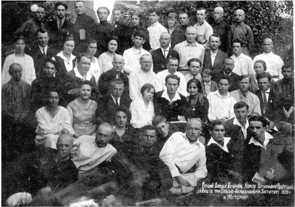
Перший випуск вечірніх курсів при ЖСГІ, 1930 р.