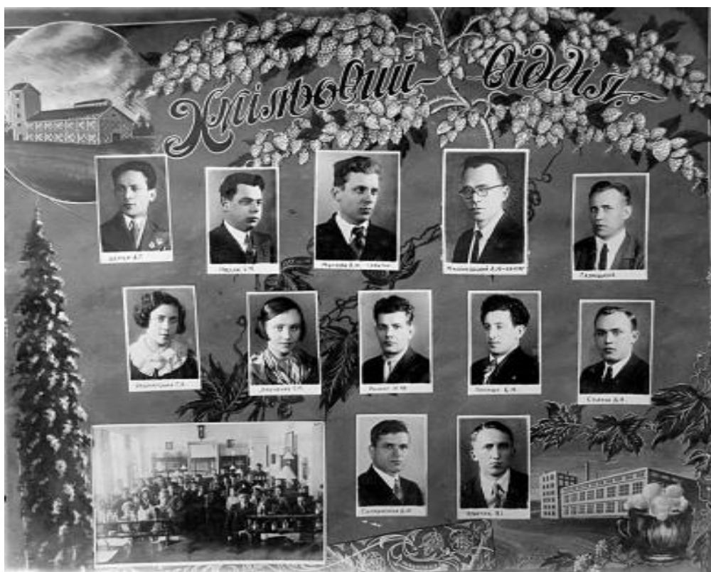
Хмельовий відділ ЖСГІ, 1933-1937 рр.