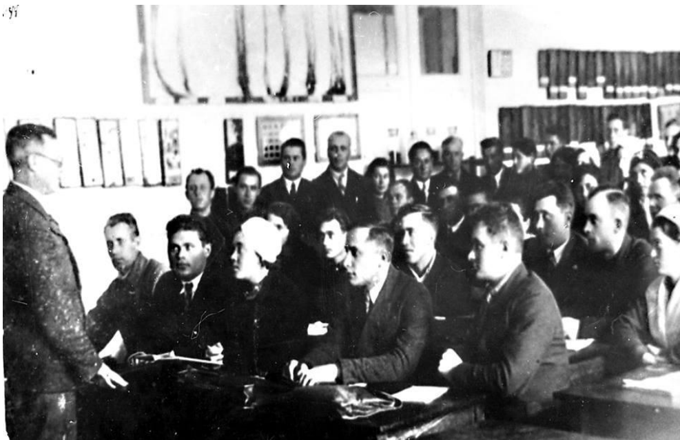
Заняття на робітничому факультеті