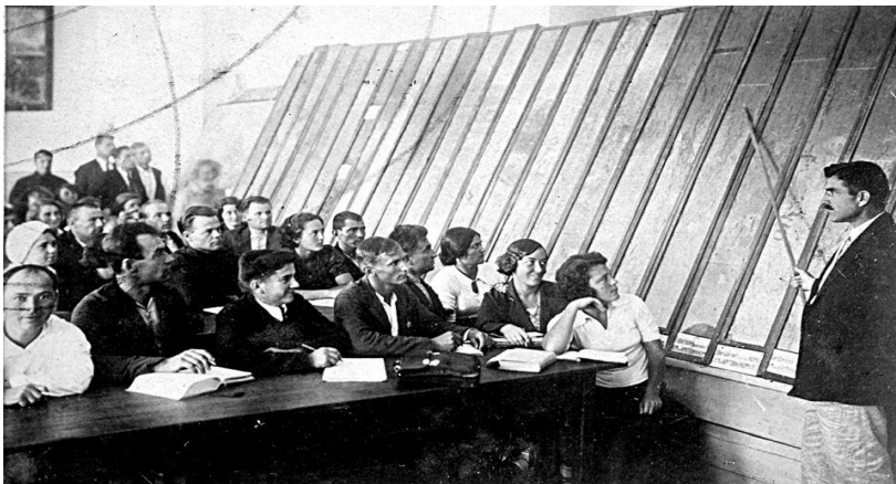
Заняття з ґрунтознавства на курсах з підвищення кваліфікації працівників сільського господарства, 1935 р.