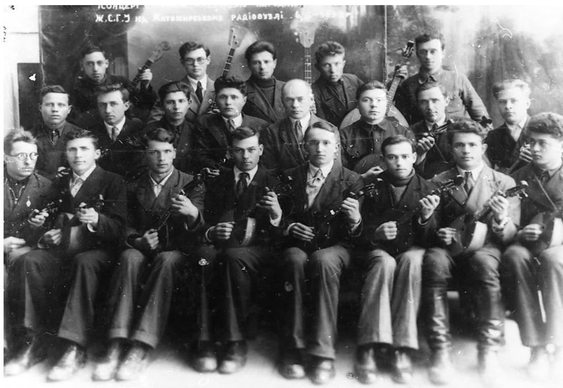
Ансамбль струнних народних інструментів Житомирського сільськогосподарського інституту, 1938 р.