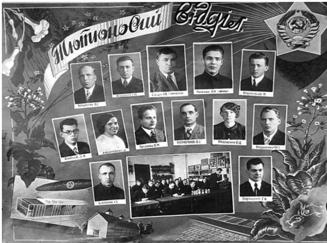
Тютюновий відділ ЖСГІ, 1933-1937 рр.