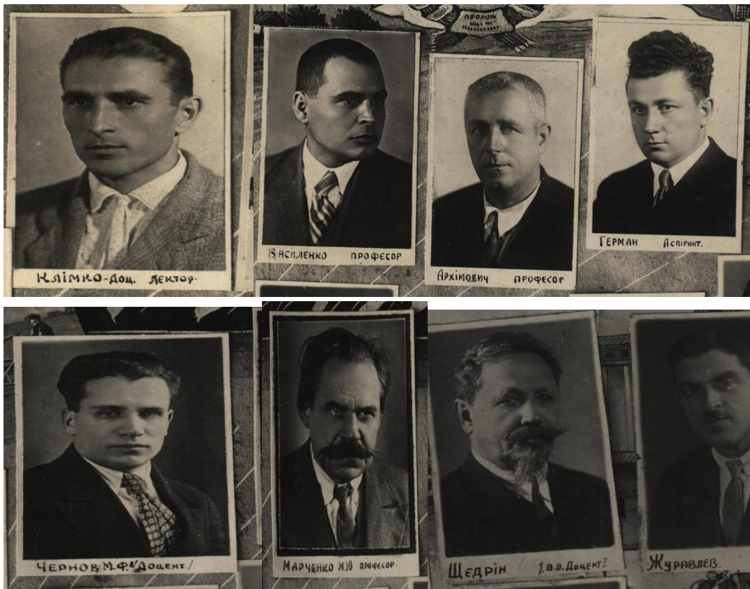
Викладачі Житомирського сільськогосподарського інституту, 1933-1937 рр.