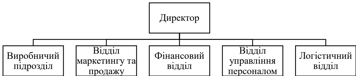
Рис. 2.1 Організаційна структура ПрАТ «Звягельхліб»