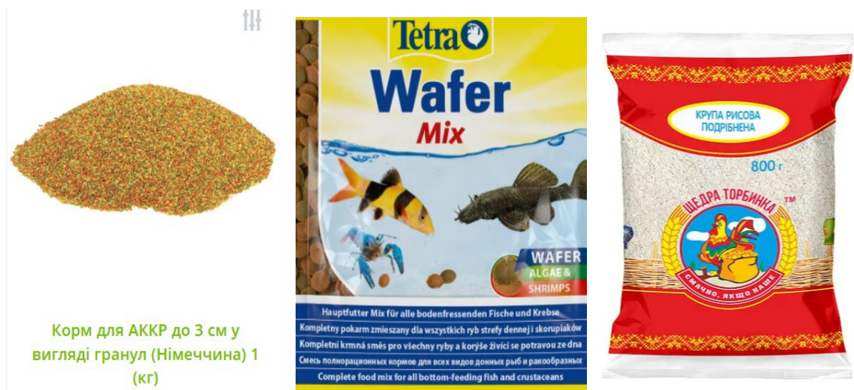
Корм для АККР до 3 см у вигляді гранул (Німеччина) 1 (кг)

Впродовж 2 місяців з молодим поколінням австралійського червоноклешневого рака також проводились вивчення росту розвитку австралійського червоноклешневого рака у молодому віці в установках замкнутого водопостачання залежно від годування, для цього використовувались корми фірми Tetra, а саме пластинки що тонуть Tetra Wafer Mix, спеціалізованій гранульований корм для австралійських червоноклешневих раків виробництва Німеччини та рисова крупа розміром 1,5-2мм.