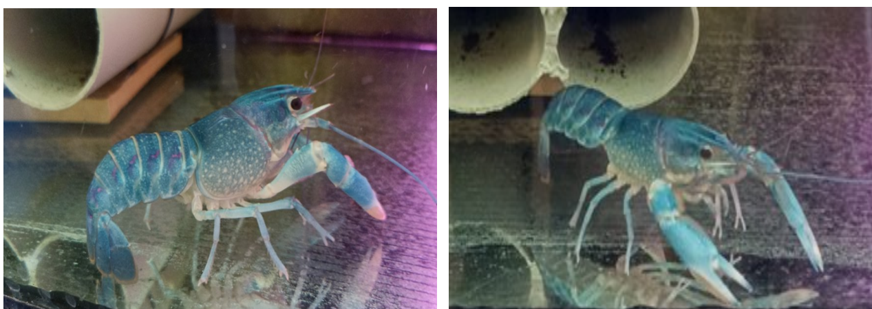
Рис.3.4. Самець та самка австралійського червоноклешневого рака

Додавання рисової крупи до обох типів комерційних кормів (як до пластинок, так і до гранульованого корму) призвело до зниження ефективності раціону в порівнянні з чистим комерційним кормом (особливо це видно на прикладі гранульованого корму, де виживання знизилося з 69% до 61%, а приріст біомаси — з 321,4 г до 282,5 г). Це свідчить про те, що рисова крупа, ймовірно, не забезпечує необхідного балансу поживних речовин, необхідних для оптимального розвитку раків, або гірше засвоюється.