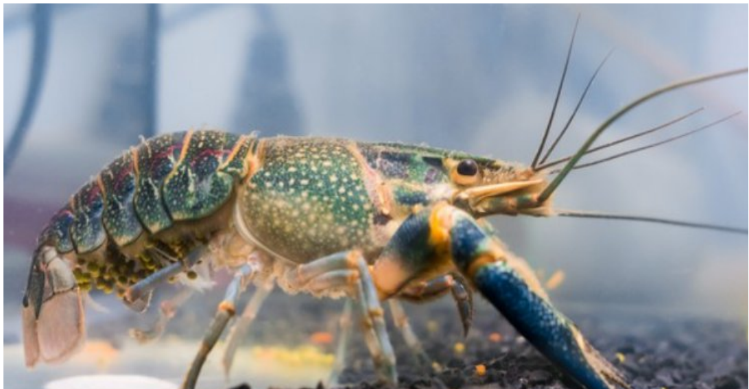
Рис.3.2 Самка австралійського червоноклешневого рака під час виношування ікри (40-42 доба)

Виношування ікри тривало 42-45 діб, рачата після вилуплення ще 15-16 діб знаходились на черевці самки, за цей час у личинок раків відбулось первинне формування та 2-х разова заміна хітинової оболонки, після того як рачата почали самостійно харчуватись та повністю відокремились від самок, останніх було повернуто до акваріумів з самцями.