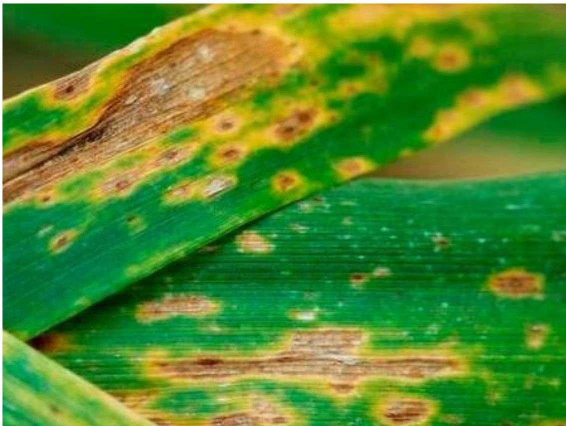
Фото 1.2. Септоріоз спельти озимої – Septoria tritici .

Септоріоз спельти озимої (фото 1.2) викликають представники роду Septoria , найпоширенішим серед яких є Septoria tritici . Гриб уражає листя, стебла та колоски, що призводить до зниження фотосинтетичної активності рослин та, як наслідок, врожайності [2-7].