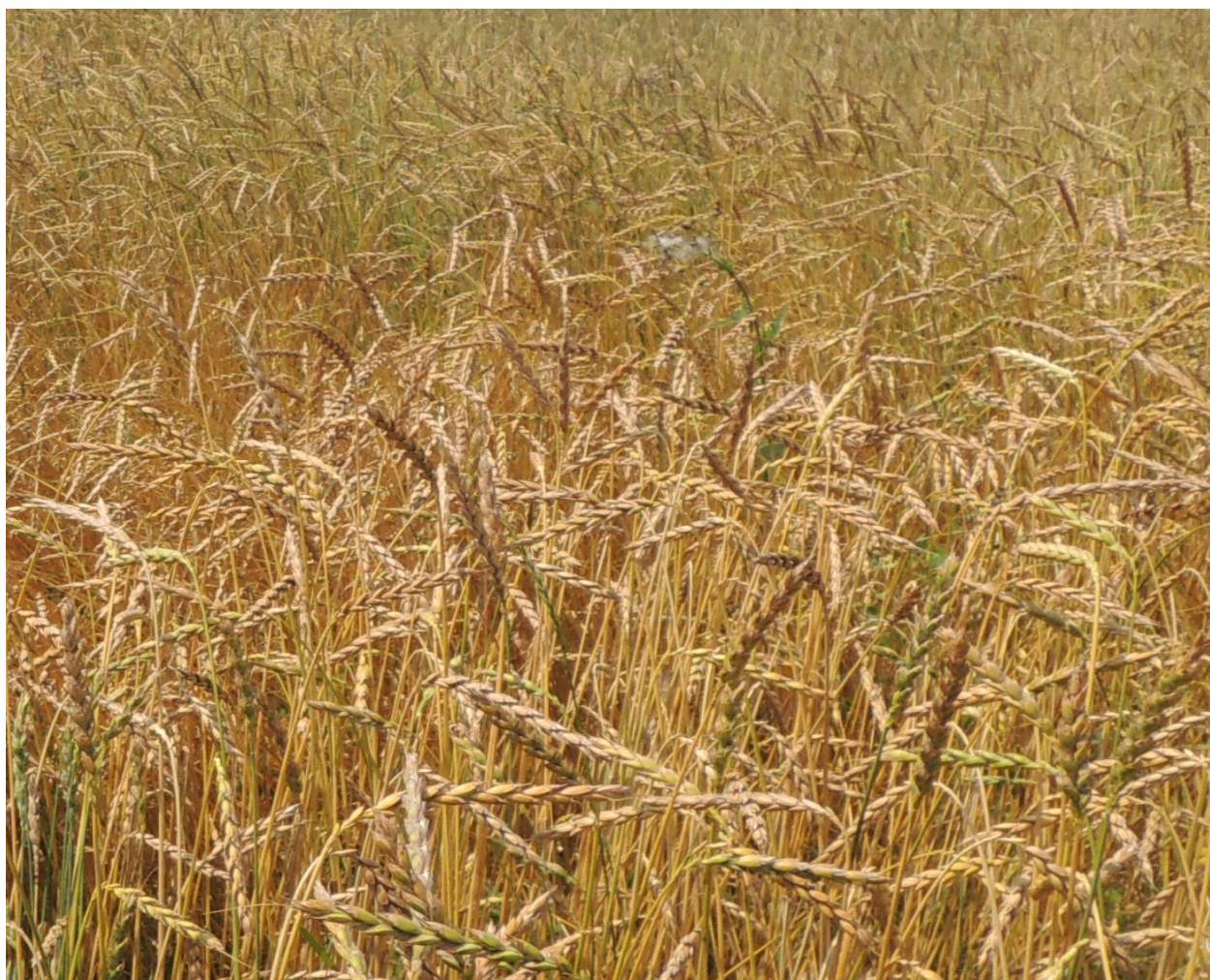
Фото 1.1. Спельта озима - Triticum spelta

Спельта озима ( Triticum spelta ) (фото 1.1) – одна з найдавніших культурних рослин, яка зберігає свою актуальність і сьогодні завдяки своїм високим поживним і дієтичним властивостям. В умовах сучасного землеробства, особливо в органічному виробництві, спельта користується великим попитом. Однак, як і інші зернові культури, спельта уражується збудниками різних хвороб, що можуть значно знижувати врожайність і якість зерна [4]. Тому нашою метою є детальний аналіз грибної хвороби – септоріозу спельти озимої та біологічного контролю його розвитку [1-8].