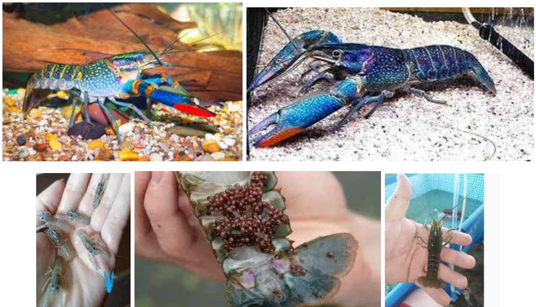
Рис. 3. Австралійські червоноклешневі раки

В господарських умовах СТОВ «Промінь» Вінницької області для виробництва ракоподібних використовують австралійських червоноклешневих раків – рисунок 3.