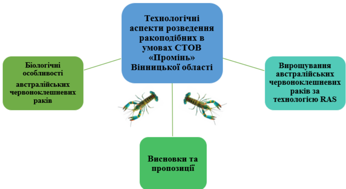
Рис. 2. Схема дослідження

Як матеріали для проведення наукових досліджень було використано інформаційні дані щодо технологічних параметрів вирощування ракоподібних в умовах в умовах СТОВ «Промінь» Вінницької області, які були опрацьовані згідно з загально відомими методиками з наукової літератури [24, 26, 33-40].