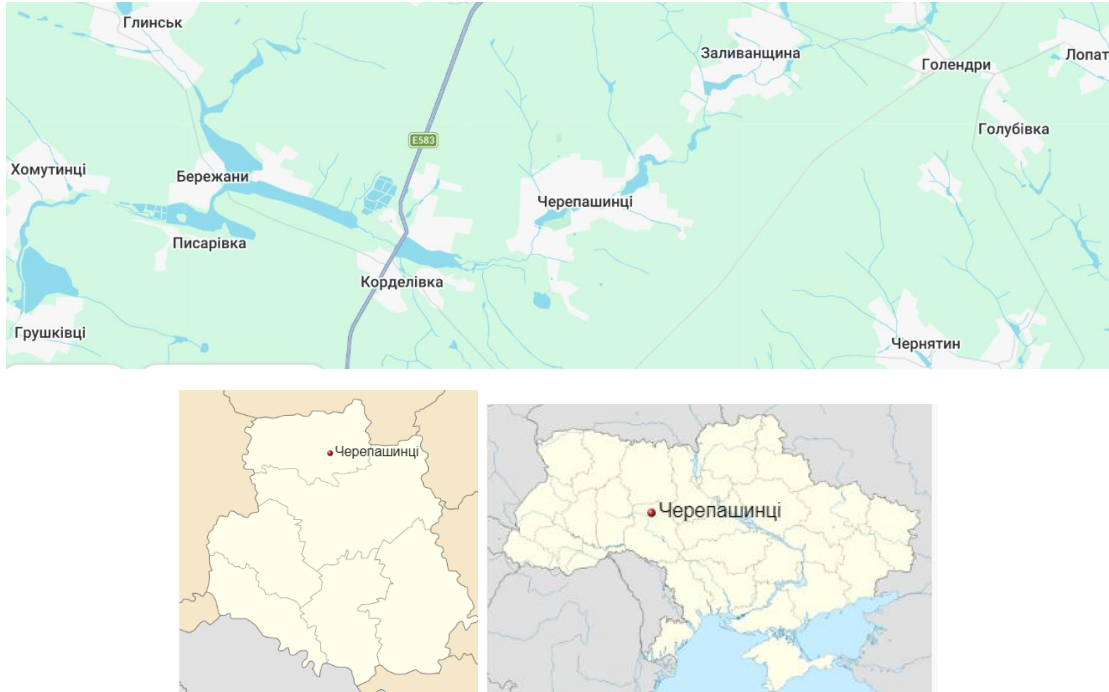
Рис. 1. Місцезнаходження СТОВ «Промінь»

Місцезнаходження підприємства свідчить про його діяльність у сільській місцевості, що відповідає аграрному профілю товариства. Саме за цією адресою здійснюється офіційна реєстрація та ведення документації юридичної особи [29].